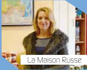
La Maison Russe

52 rue Saint Nicolas 49400 Saumur 02 41 40 96 20 www.saumur1929.com f Saumur 1929 Bar à Tapas