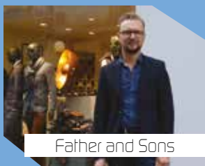
Father and Sons