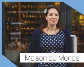
Maison du Monde