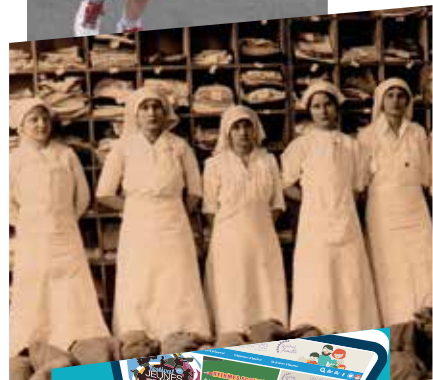
culture p 05