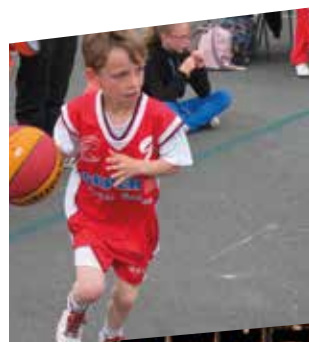
actualités p 03