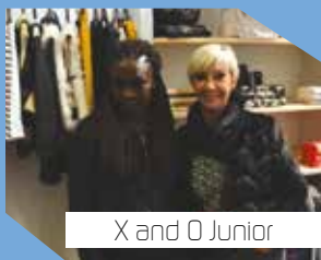
X and O Junior