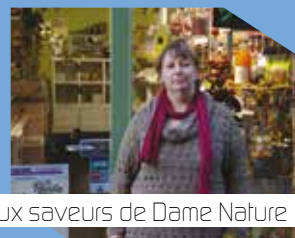
Aux saveurs de Dame Nature