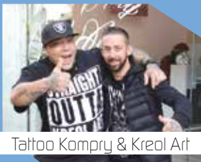
Tattoo Kompry & Kreol Art

32, place Bilange 49400 Saumur 02 41 51 08 77