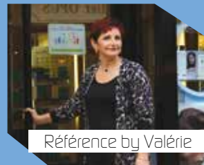
Référence by Valérie