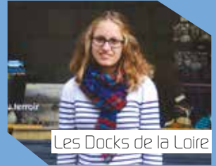
Les Docks de la Loire

27, Rue Molière 49400 - Saumur 09 70 94 73 97