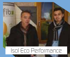
Isol Eco Performance