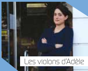
Les violons d'Adèle