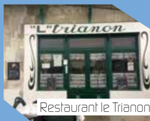
Restaurant Le Trianon