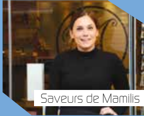
Saveurs de Mamilis

15, rue du Puits Neuf 49400 Saumur 02 41 34 21 62 f Ty's Yeux Saumur