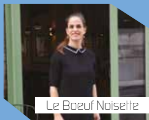
Le Boeuf Noisette