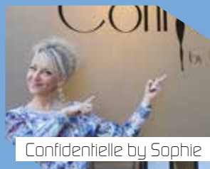
Confidentielle by Sophie