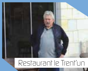
Restaurant le Trent'un