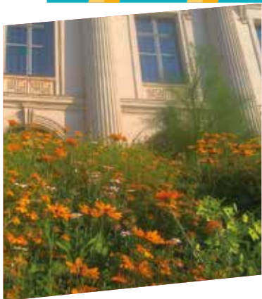
environnement p 08