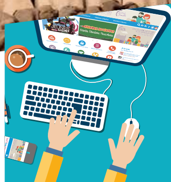
dossier p 06