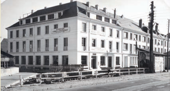
L'hôtel du roi René reconstruit. vers 1950.