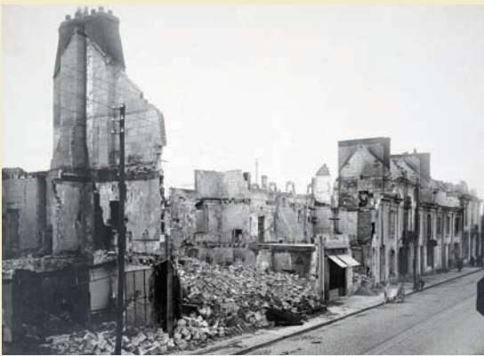
Immeubles sinistrés rue Nationale : îlot entre la rue du Petit Pré et la rue Paul Bert. vers 1944.