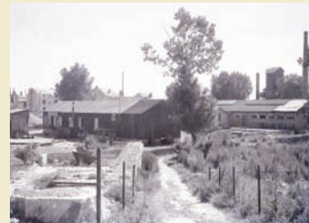
Baraquements square de la Boire-Quentin. Photo non datée (AD Maine-et-Loire).

La crise du logement résultant de la guerre est aggravée par l'insuffisance du parc locatif dès avant 1939 et par l'état de vétusté des immeubles anciens. À la Libération, pour assurer le relogement d'urgence des sinistrés, le recours aux constructions provisoires était donc l'unique solution. De nombreuses baraques en bois, en partie récupérées au camp militaire américain de Fontevraud, servent d'habitations ou de locaux commerciaux ; elles sont installées dans les quartiers sinistrés, notamment place de la Boire-Quentin et rue Nationale (actuelle avenue De Gaulle).