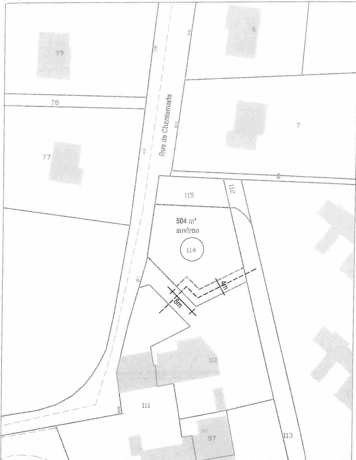
VILLE DE SAUMUR - Secteur Chantemerle Parcelle 016 DY 114 : 600m 2