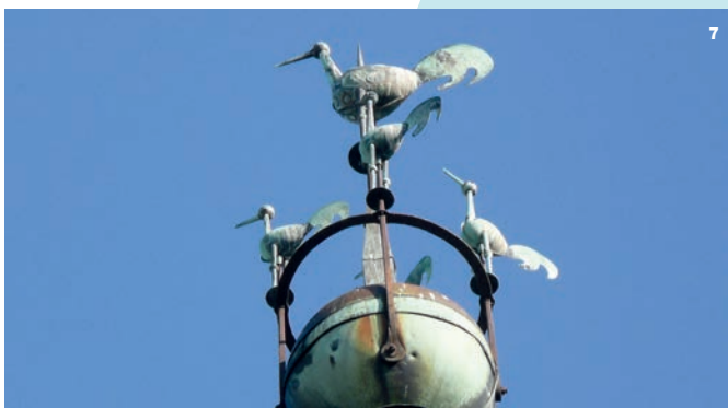
6. Façade du bastion de l'Hôtel de Ville donnant sur la cour, gravure de Victor Petit, 19 e siècle