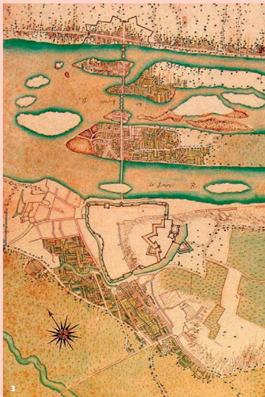
3. Plan de Saumur vers 1621

Ce bastion est presque totalement reconstruit à la fin du 15 e siècle, pour être transformé en un hôtel de ville digne de la cité, en une situation avantageuse face à la Loire.