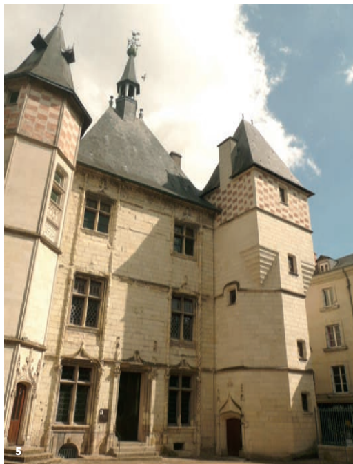
4. Façade du bastion de l'Hôtel de Ville donnant sur la Loire