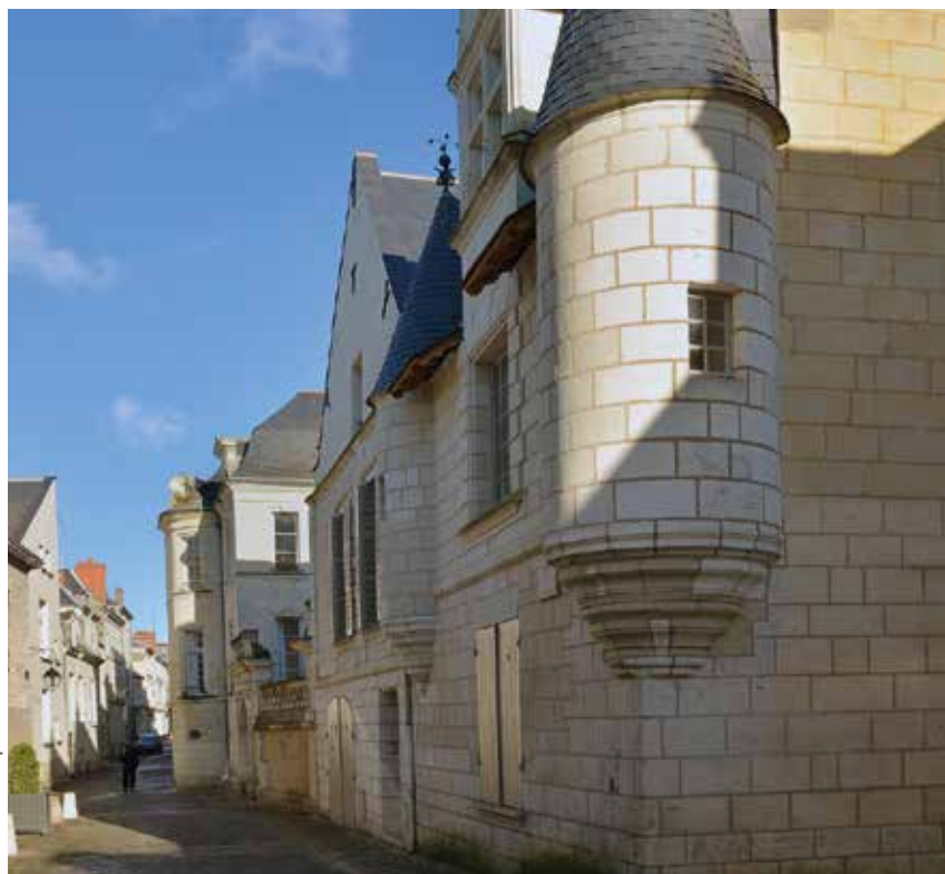
Rue du Temple